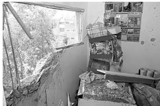
Durch Raketenbeschuss zerstörte Wohnung in Sderot

AMCHA Deutschland e.V. unterstützt das gleichnamige Nationale Israelische Zentrum zur psychosozialen Betreuung von Holocaust-Überlebenden.